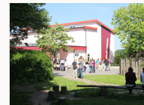
Sporthalle mit Mensa